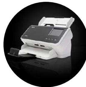
Escáneres Alaris S2060w/S2080w