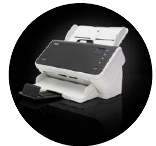
Escáneres Alaris S2050/S2070